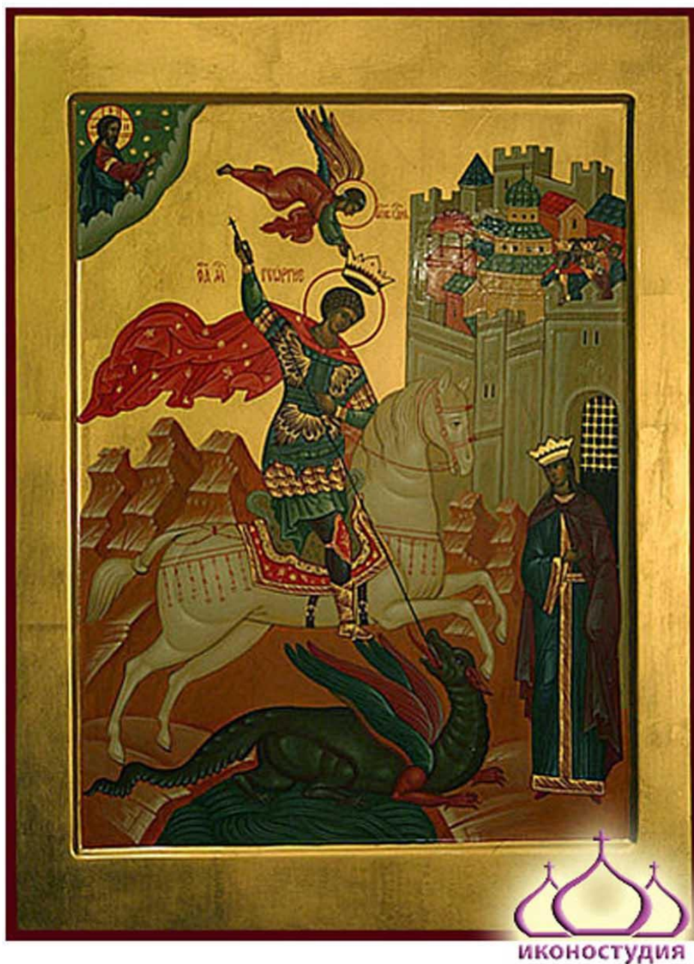
Святого великомученика Георгия Победоносца