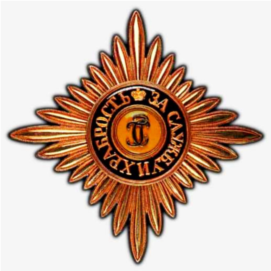
Орден Святого Георгия